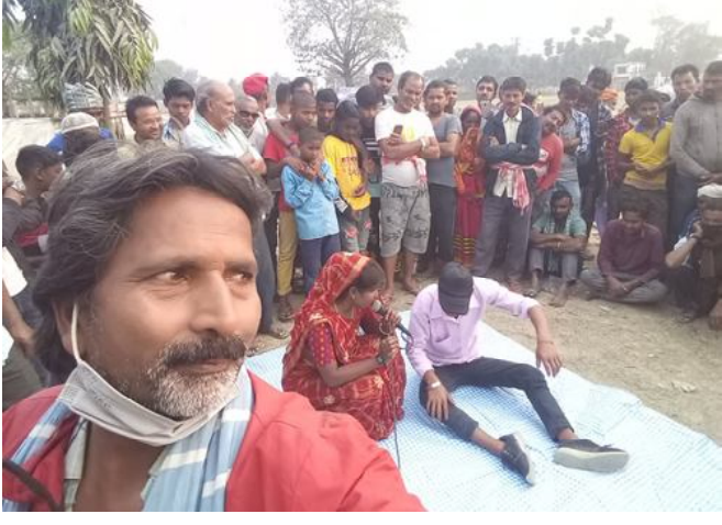
राजविराज/कोशी पीडित समाजको आयोजनामा स्वच्छताका

लागि व्यवहार परिवर्तन अन्तरगत कोभिड रेस्पोजन्स तथा सरसफाइ